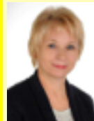
Wicestarosta Urszula Wołosiewicz

Mieczkowskiego 4 i jest czynne od poniedziałku do piątku w godz. 8.00 – 16.00.