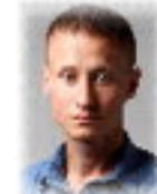
Zapraszamy na stronę: facebook.com/ostrowskagramiejska

Impreza spotkała się z bardzo pozytywnym przyjęciem. Mamy nadzieję, że to dopiero początek gier miejskich w Ostrowi Mazowieckiej i wkrótce ruszymy z kolejną edycją.