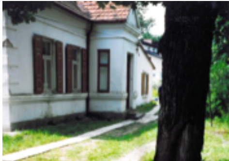
Budynek obecnego Muzeum na zdjęciu sprzed lat

O lokalnym muzeum jako instytucji publicznej mówiło się w Ostrowi Mazowieckiej od początku lat 60. ubiegłego wieku. Zainicjowane 12 stycznia 1962 r., na posiedzeniu Prezydium Miejskiej Rady Narodowej w Ostrowi Mazowieckiej, Towarzystwo Miłośników Ziemi Ostrowskiej tak widziało sprawę muzeum w swoim Statucie: